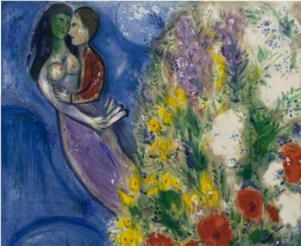
Love and Life (1954-1957, Marc Chagall)

... quale migliore partenza per il nostro viaggio della ri-scoperta della nostra coppia?